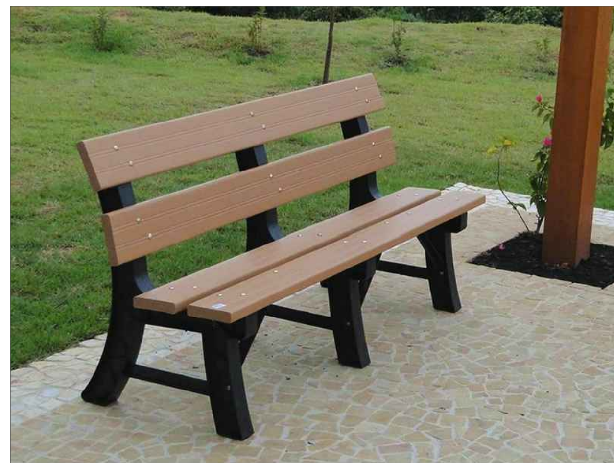
BANCO EM MADEIRA PLÁSTICA