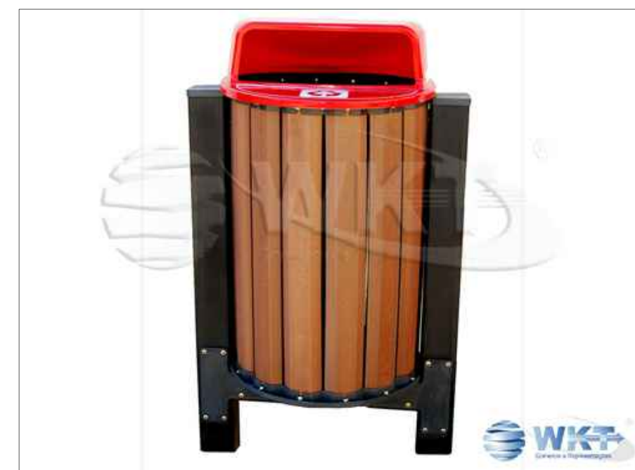
LIXEIRA EM MADEIRA PLÁSTICA